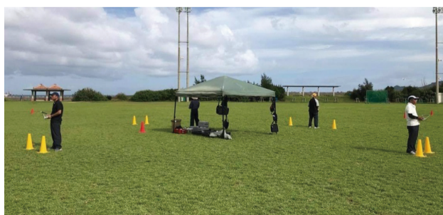
インストラクターが丁寧に指導します。