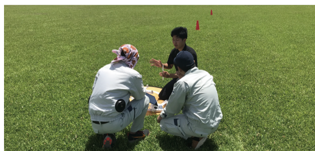
座学教育、飛行技能試験を実施致します。