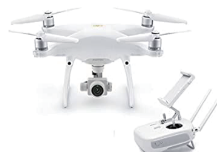
実技講習の際はPhantom4を使用します。

DRONE TRAININGの開催日時、お申し込みについてはこちらから→ http://skysynapse.co.jp/service/drone_training.html